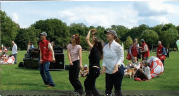
EURO 2008 – EVANJELIZÁCIE POČAS FUTBALOVÝCH MAJSTROVSTIEV