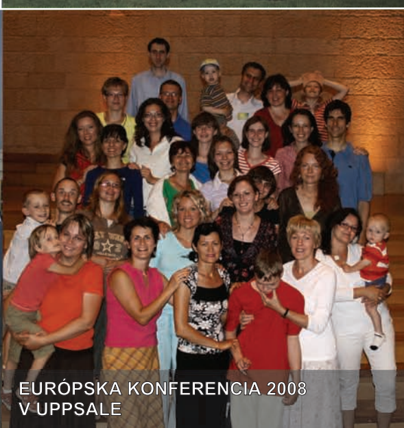
EURÓPSKA KONFERENCIA 2008 V UPPSALÉ