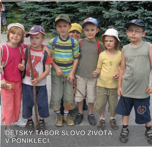
DETSKÝ TÁBOR SLOVO ŽIVOTA V PONIKLECI