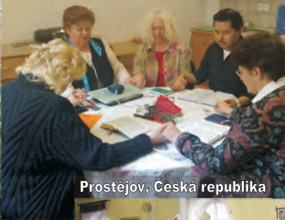
Prostějov, Česká republika