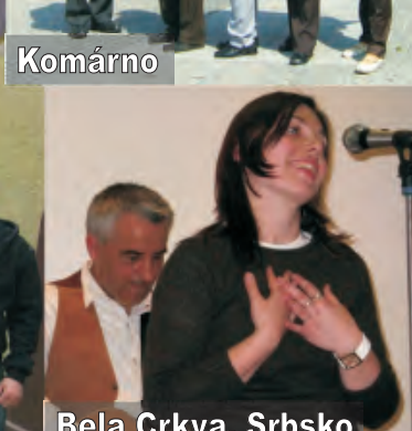
Bela Crkva, Srbsko