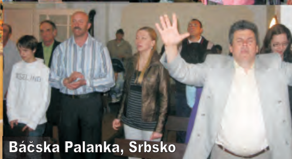
Báčska Palanka, Srbsko