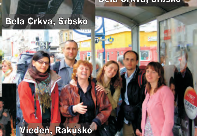
Bela Crkva, Srbsko