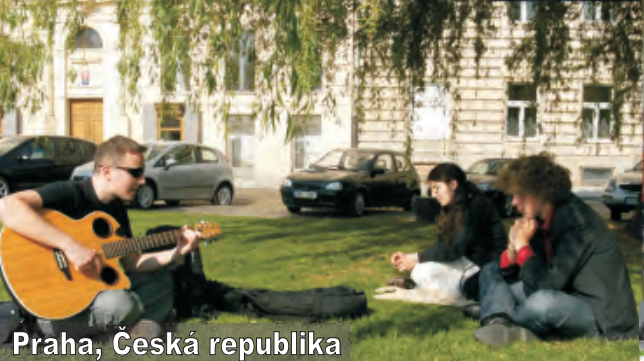
Praha, Česká republika