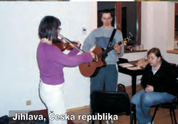
Jihlava, Česká republika