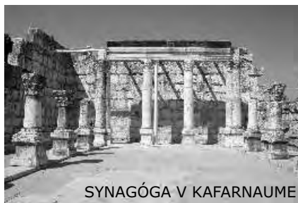
SYNAGÓGA V KAFARNAUME

mestom. Ulice, ktoré pretínali biblický Jeruzalem, boli práve také úzke a točité ako uličky v dnešnom Starom meste. Rovnako ako mnoho miestnych predavačov vyvoláva ceny svojho tovaru dnes, bolo to aj v časoch Ježiša. Len samotný tovar sa trošku zmenil. Za Ježišových čias väčšina malých obchodov a stánkov na trhu ponúkala kurence, chlieb, sušené ovocie, farbené