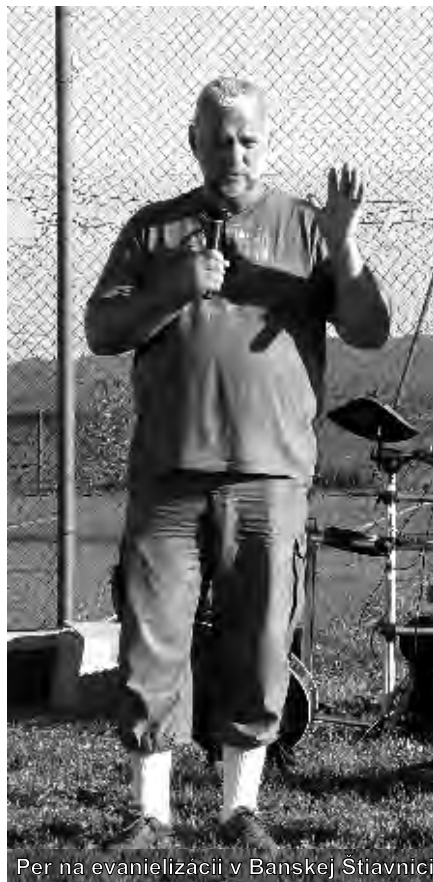
Per na evanjelizácii v Banskej Štiavnici

Hoci Slovensko je krajina s kresťanskou históriou a ľudia majú poznanie o Bohu, len málokto ho poznajú osobne. Som však presvedčený o tom, že Boh má pre cirkev na Slovensku pripravenú úžasnú budúcnosť. Čo sa týka miestnych zborov a vedúcich, niektorí z nich budú musieť porásť v zodpovednosti a v smelosti. Pre mnohých vedúcich však bolo veľkým povzbudením vidieť, keď odrazu do ich