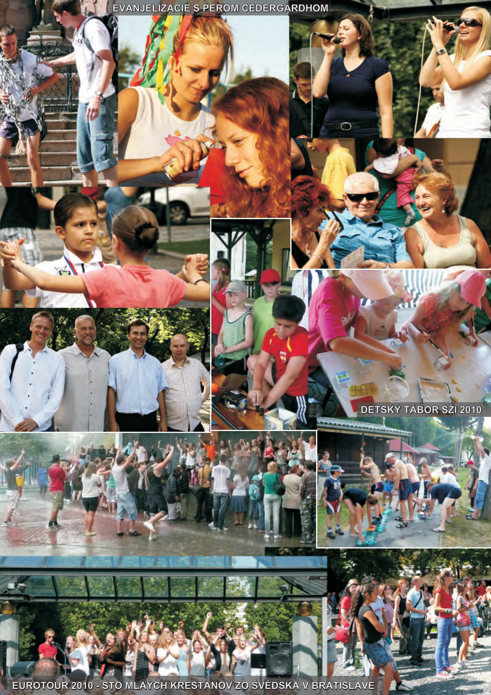
DETSKÝ TÁBOR SŽI 2010