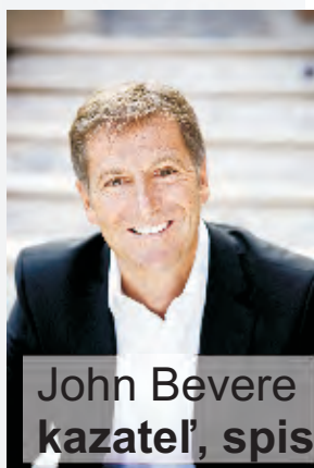
John Bevere kazateľ, spisovateľ a autor mnohých bestsellerov

„Niet väčšieho povolania či zámeru pre život, než poznať Boha a byť ním poznaný,“ povedala výstižne o tejto knihe Joyce Meyerová , autorka kníh Bojisko v mysli a Sto spôsobov na zjednodušenie vášho života .